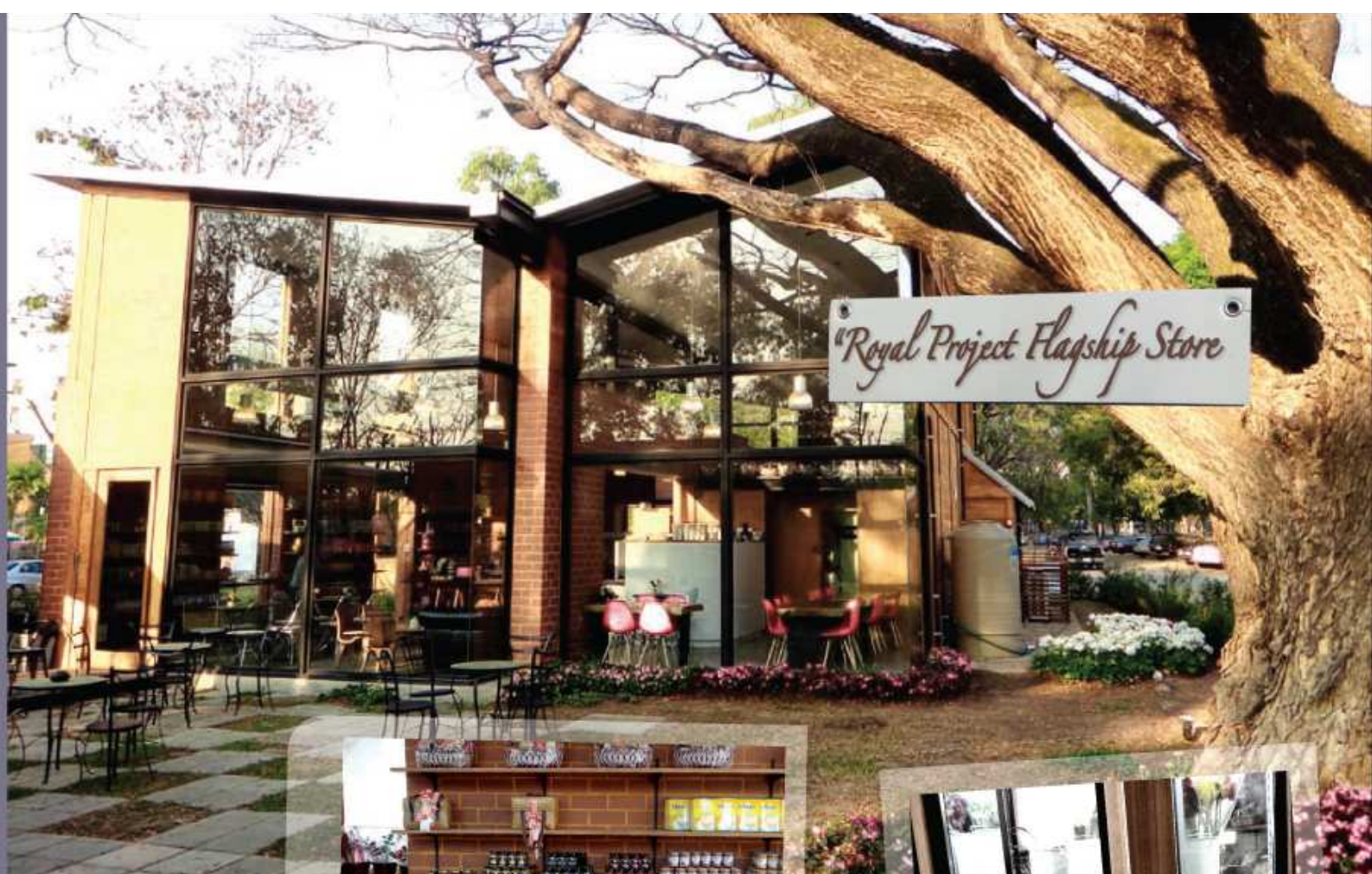
Royal Project Flagship Store